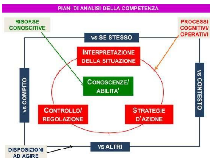
Tav. 1 Piani di analisi dell'apprendimento in chiave di competenza

Preliminarmente si prevede una ricognizione dei documenti istituzionali (Indicazioni nazionali, traguardi di competenza per asse culturale per il primo biennio; supplemento Europass al certificato di diploma), da sintetizzare in un breve documento.