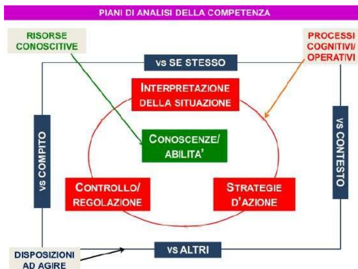
Tav. 1 Piani di analisi dell'apprendimento in chiave di competenza

Preliminarmente si prevede una ricognizione dei documenti istituzionali (Indicazioni nazionali, traguardi di competenza per asse culturale per il primo biennio, secondo biennio, quinto anno; supplemento Euro pass al certificato di diploma)