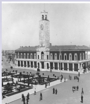
La redenzione dell' Agro pontino - Duilio Cambellotti