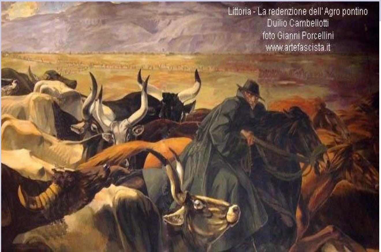
Littoria - La redenzione dell' Agro pontino Duilio Cambellotti