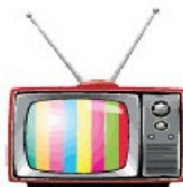
Audiovisivo e Multimedia